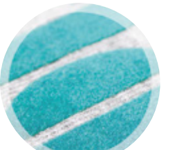
MATIÈRE DE FLOCAGE