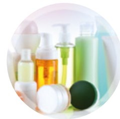
PLASTURGIE (packaging, polymères...)