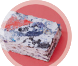
BRIQUES, BÉTONS ET CEMENTS