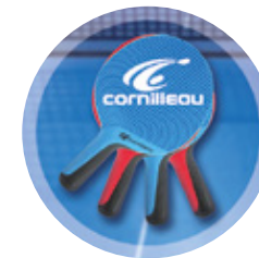
ACCESSOIRES DE SPORT / MOBILIER DE JARDIN / PIÈCES DÉTACHÉES