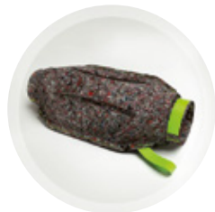
NON-TISSÉS MOULÉS POUR LES ÉQUIPEMENTS DES BÂTIMENTS