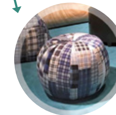
ASSEMBLAGES DE COUPONS