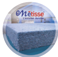
NON-TISSÉS POUR L'ISOLATION STRUCTURELLE DES BÂTIMENTS