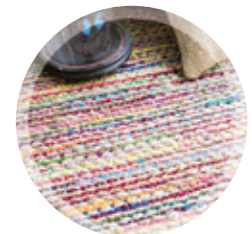
CHIQUETTES TISSÉES OU TRICOTÉES