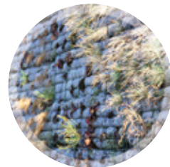
SUBSTRATS / GÉOTEXTILES / MURS VÉGÉTALISÉS