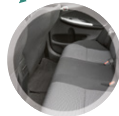
NON-TISSÉS POUR L'AUTOMOBILE