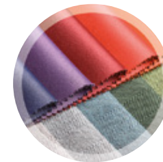
FIL POUR TISSUS OU TRICOTS TECHNIQUES (filaments continus)