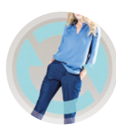
FIL POUR TISSUS OU TRICOTS