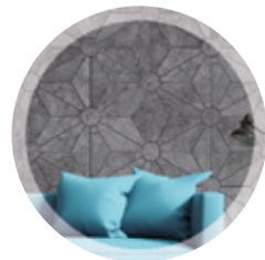
NON-TISSÉS POUR L'ISOLATION ET LA DÉCORATION DES BÂTIMENTS