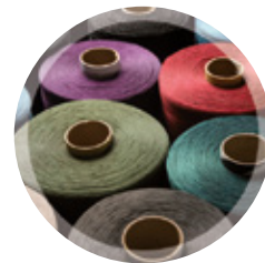
FIL POUR TISSUS OU TRICOTS