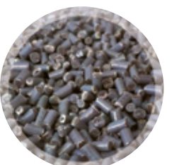
COMBUSTIBLE SOLIDE DE RÉCUPÉRATION